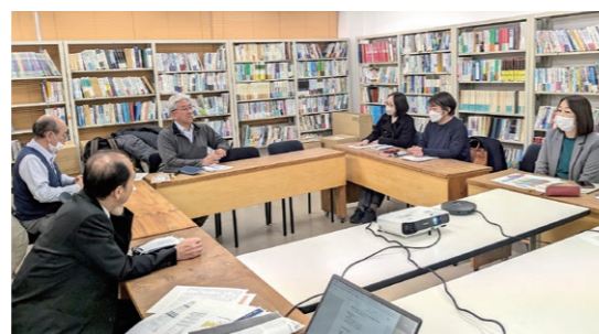
運営委員会の様子

一般社団法人おかやま精神医療アドボケイトセンターでは、毎月1回運営委員会を行っています。会議には法人の理事・正会員・運営スタッフが参加をして、当法人の組織運営、各事業実施のための話し合いを繰り返し、年間の事業を実施しました。活動の中で見えてきた課題についても共有し、改善策について検討を重ねています。